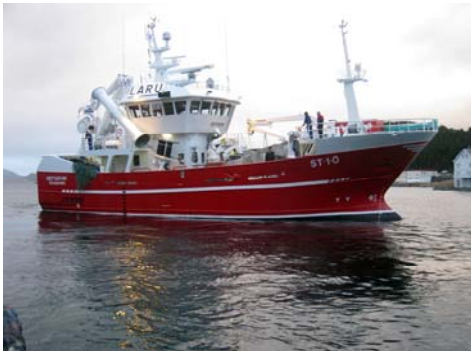
(m/s "Hepsøhav" overlevert fra verftet i januar 2008)