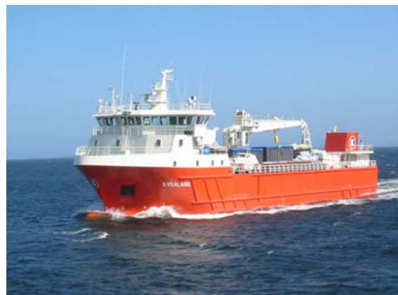
(m/s "Svealand" overlevert fra verftet i juni 2008)