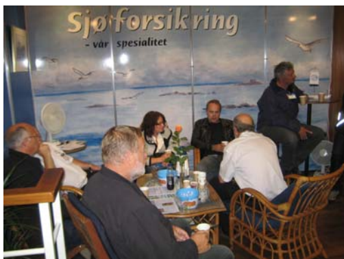
(fra vår stand under Nor-fishing 2008)

Vi håper og tror at den evigvarende ressursen som fisk er, snart får den oppmerksomhet den fortjener.