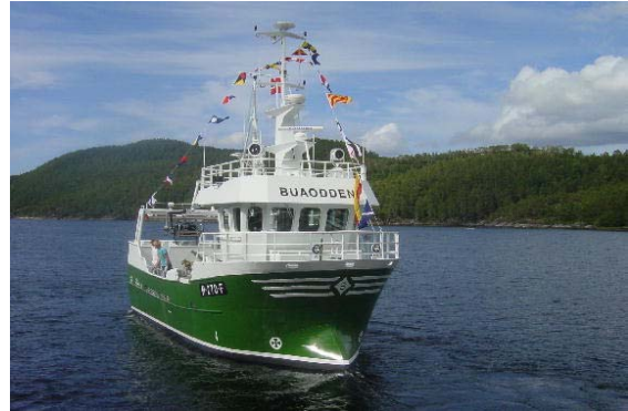
(m/s "Buaodden" overlevert fra verftet i juni 2008)

Ønsker du å vite mer om PSN, ta kontakt med oss. Vi har et eget informasjonsopplegg både når det gjelder PSN, pakkeforsikring og de øvrige forsikringsproduktene.