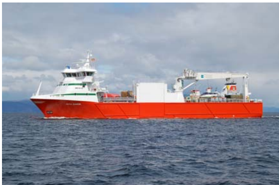
("With Junior" overlevert fra verftet i mai 2009)

Som en følge av at selskapet har inngått hovedavtale med Gjensidige Forsikring BA, vil vi i løpet av neste år kunne formidle til våre medlemmer de samme forsikringsprodukter som Gjensidige har. Dette gir våre medlemmer en klar fordel ved at en kan forholde seg til samme selskap med alle sine forsikringsbehov. Vi kommer tilbake med mer informasjon om dette så snart det er klart.