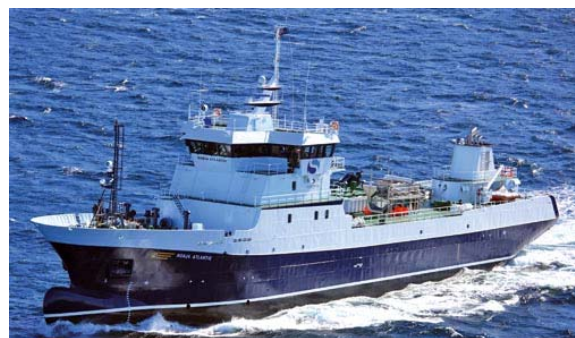
("Ronja Atlantic" overlevert fra verftet i februar 2009)

(vi kommer tilbake med dato for disse møtene)