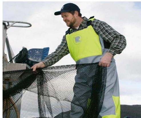
(Regatta Fisherman har blitt godt mottatt av medlemmene)

Frem mot fornyelsen arbeider vi nå med det skadeforebyggende programmet for 2010. Det er gledelig at stadig flere aktører blant leverandørene av utstyr også fokuserer mye på skadeforebyggende tiltak. Det ser ut til at det vil komme en del gode praktiske og økonomiske pakkedøsninger til neste år.