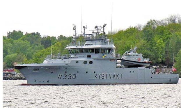
"Nornen", foto : B. A. Krohn Johansen