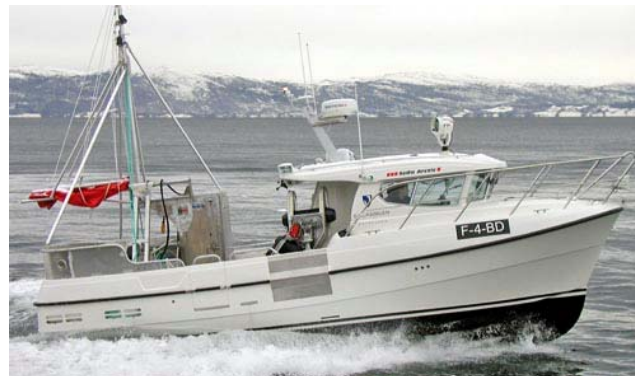
"Solheim Junior"