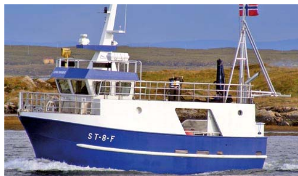
("Edna Synnøve" overlevert fra verftet i juli 2009)